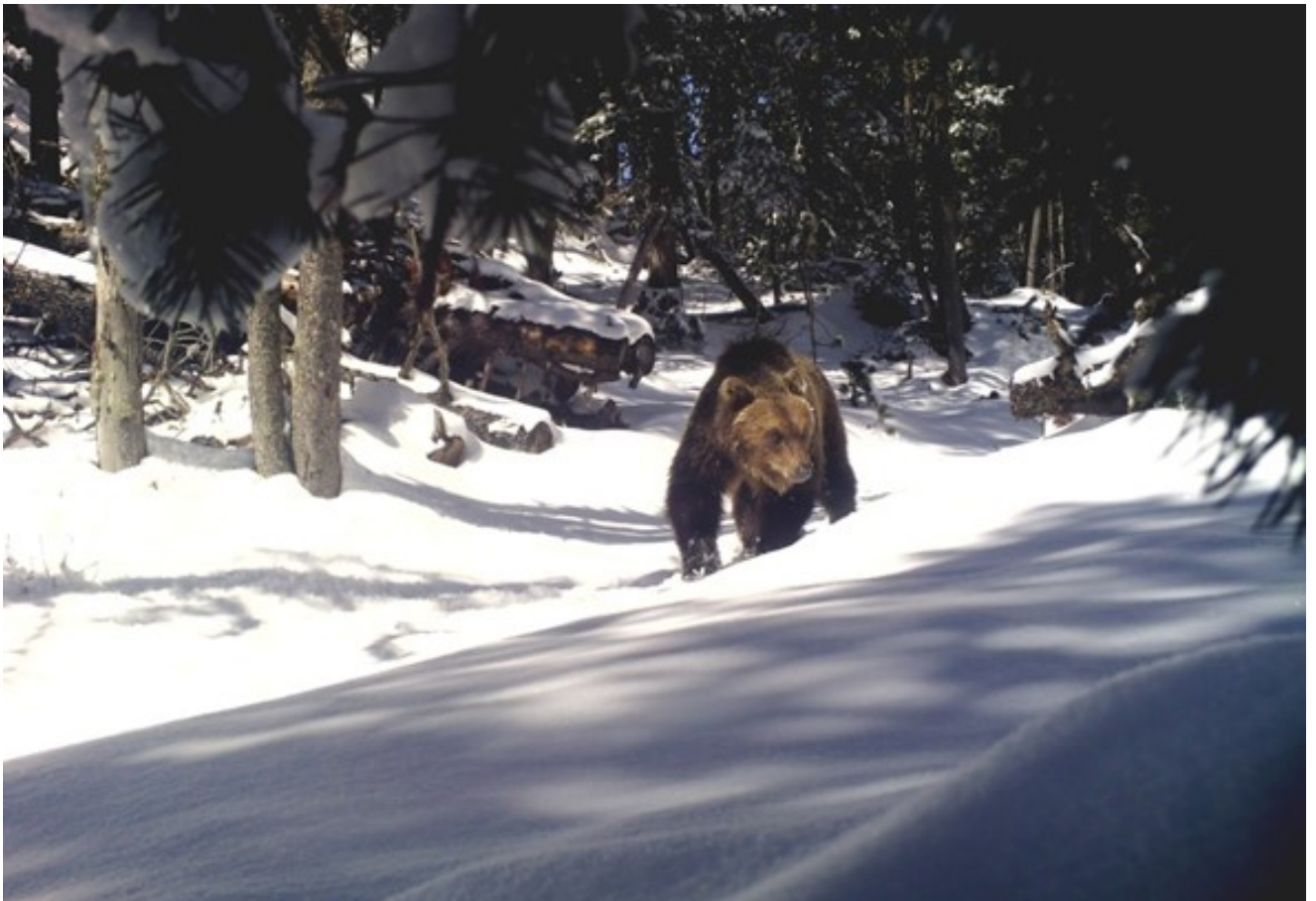
Schweizer Nationalpark 2017

Vom Bundesrat an seiner Sitzung vom 27. Januar 2021 gutgeheissen.